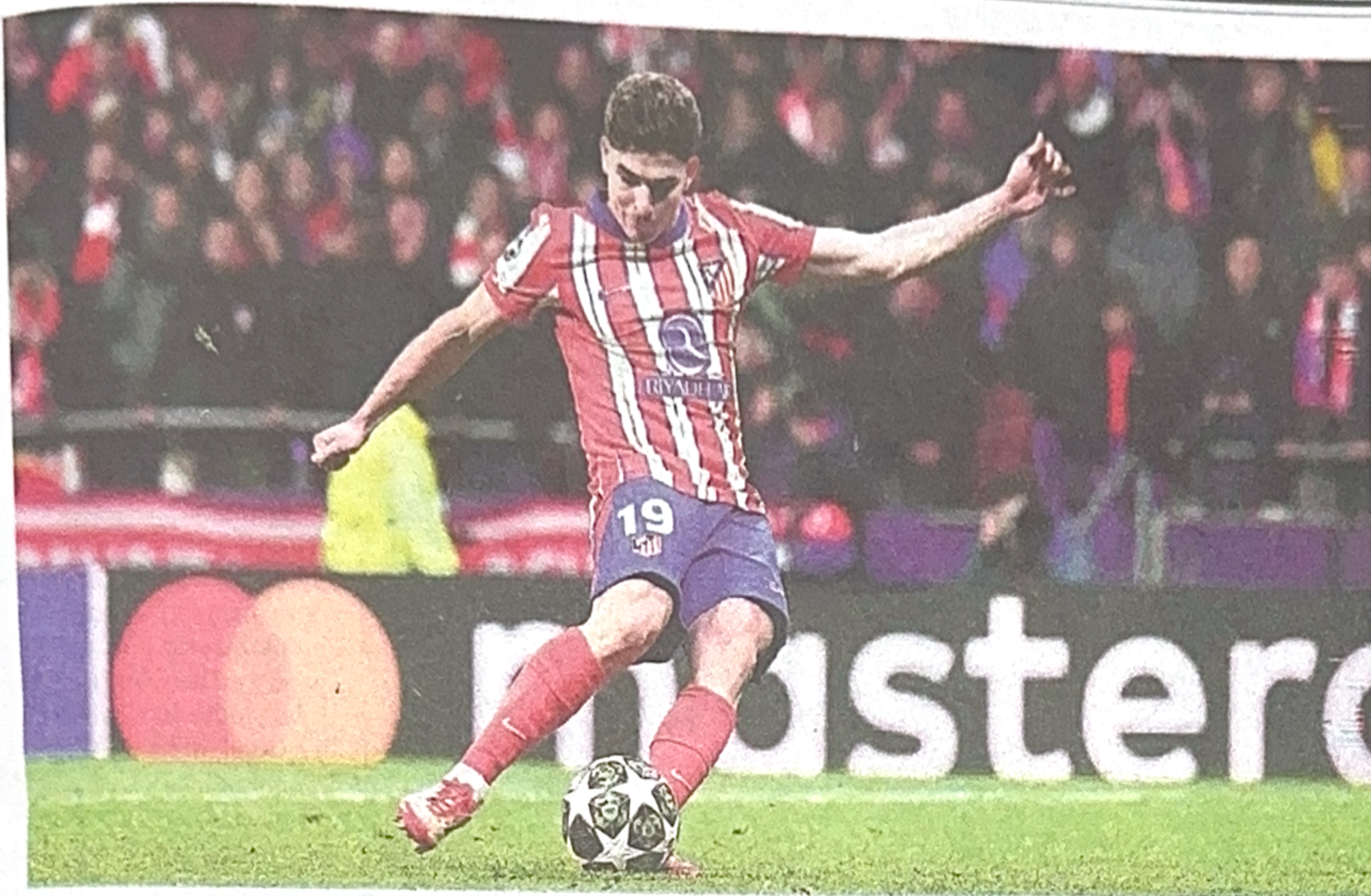
DISPARO. Preciso momento en que Julián Álvarez remata en la definición ante el Real Madrid.