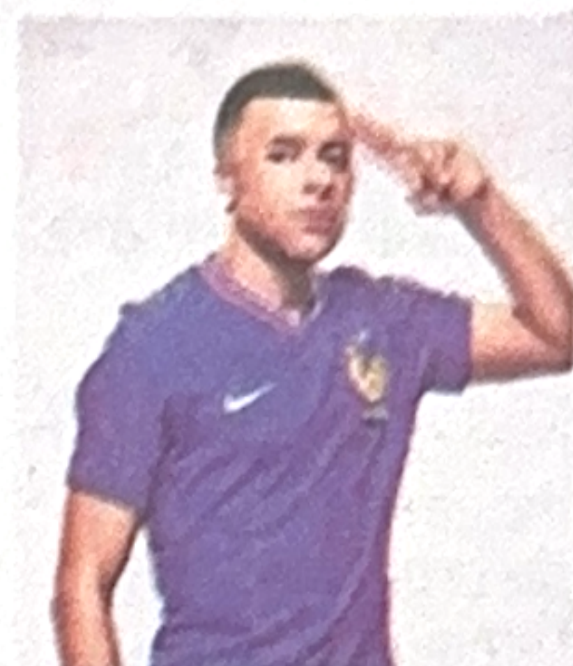
Enfrentará a Croacia.

Las llaves de cuartos de final: Lyon vs. Manchester United, Bodo/Glimt vs. Lazio, Tottenham vs. Eintracht Frankfurt y Rangers vs. Athletic Club. ♦